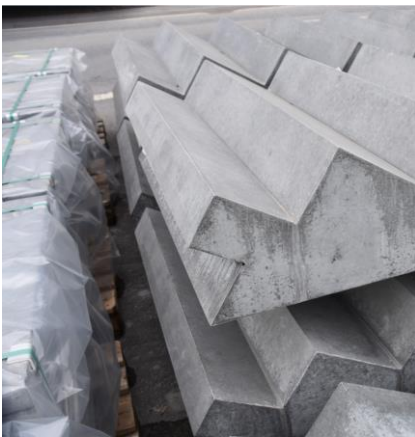
Detail von Treppen-Antritte