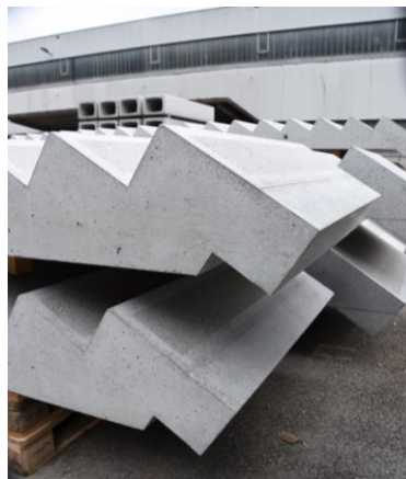
Detail von Treppen-Austritte